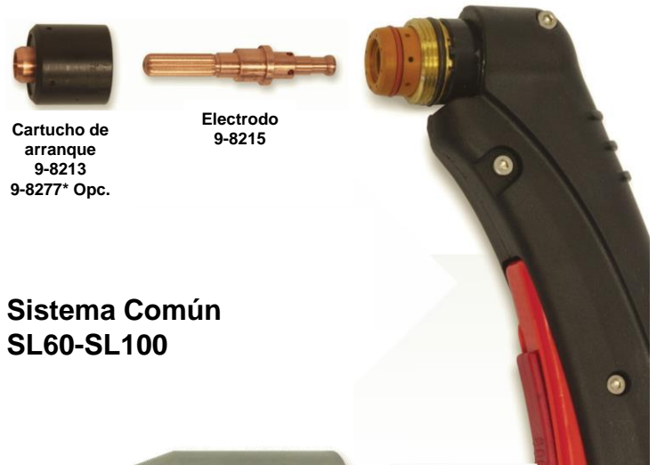
Cartucho de arranque 9-8213 9-8277* Opc.

Tabla de perfiles de resanado para la elección de la punta de