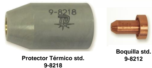
Protector Térmico std. 9-8218