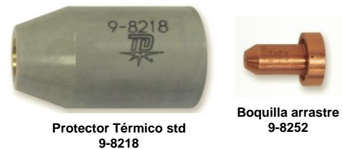
Protector Térmico std 9-8218