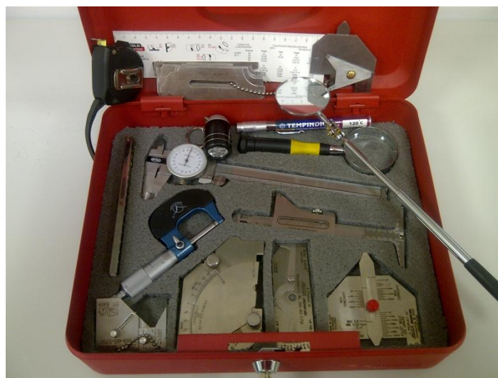
MALETÍN DE ACERO CON LLAVE DE CIERRE Y COMPARTIMENTOS PARA OTROS ACCESORIOS